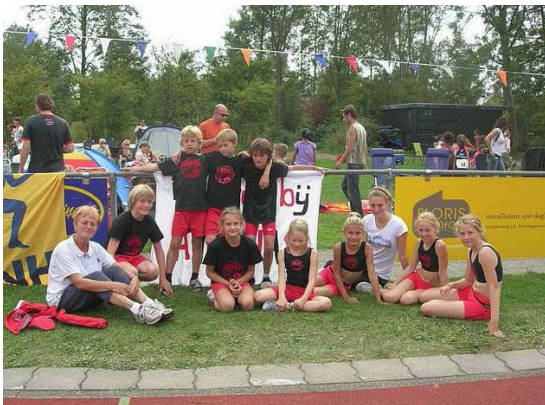
Pupillencompetitie mei 2009

Zoals eerder genoemd zal de nadruk liggen op het aanbieden van veel spelvormen waar de basisbeginselen van de atletiek in worden verwerkt.