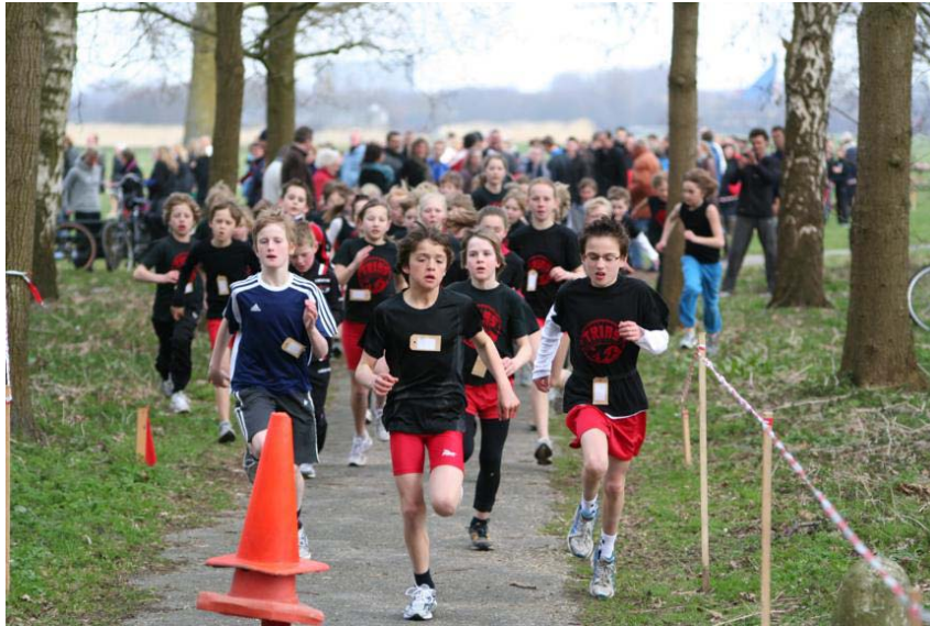
Clubkampioenschappen Cross 2010

Dit zorgt ervoor dat de trainingsaanpak enige verschillen kent.