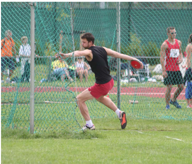
Wedstrijd op de accommodatie van AV Trias

Niet alle trainingen worden op de baan van de atletiekvereniging verzorgd. Ook het recreatiegebied het Maalwater, het Heilooërbos en de duinen worden veelvuldig voor trainingen gebruikt. Vaak vinden er combinaties plaats. Zo blijven de trainingen afwisselend en aantrekkelijk.