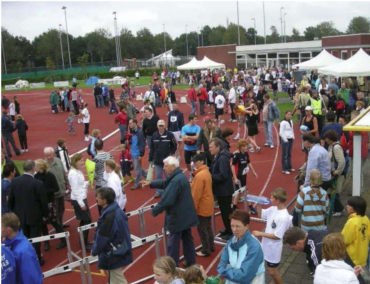
Grote drukte op de baan tijdens de Maalwaterrun 2009