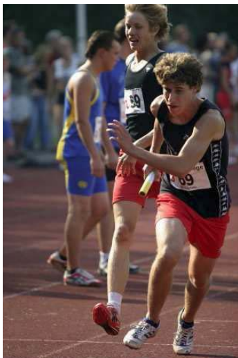
NK Estafette in Amstelveen

Dit zijn wedstrijden waarbij atleten van één vereniging met een ploeg proberen om zoveel mogelijk punten te verzamelen. De opstelling wordt dan ook gemaakt door de ploegleider, hij/zij probeert de atleten zo op te stellen, dat hiermee de meeste punten worden verdiend. Competitiewedstrijden worden afgesloten met een estafette.