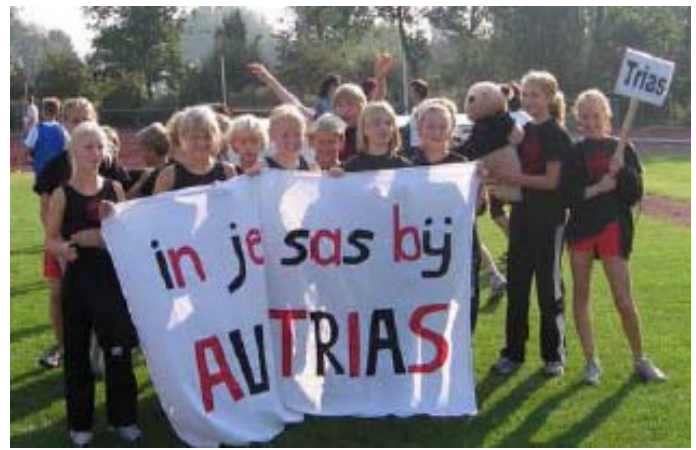
Wedstrijd bij atletiekvereniging Hera