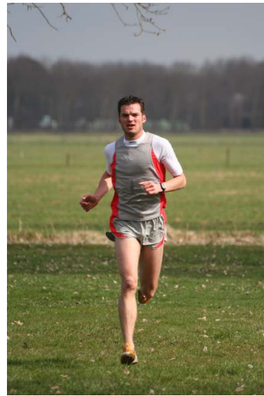
Clubkampioenschappen Cross 2010