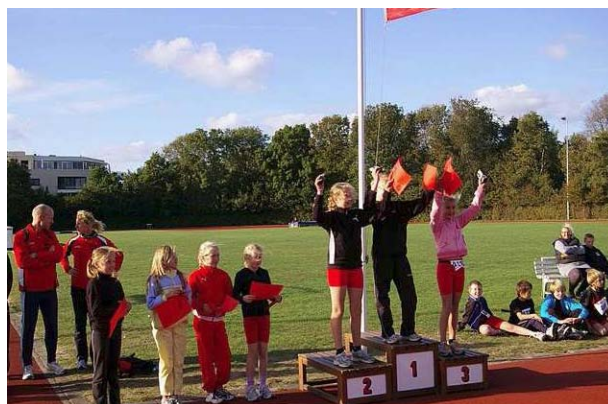
Clubkampioenschappen oktober 2009

Bepalend voor de leeftijdsindeling is het jaar waarin met de leeftijd bereikt. Om praktische redenen gaat de verandering niet per 1 januari in, maar na de clubkampioenschappen (oktober) voorafgaand van het nieuwe jaar.