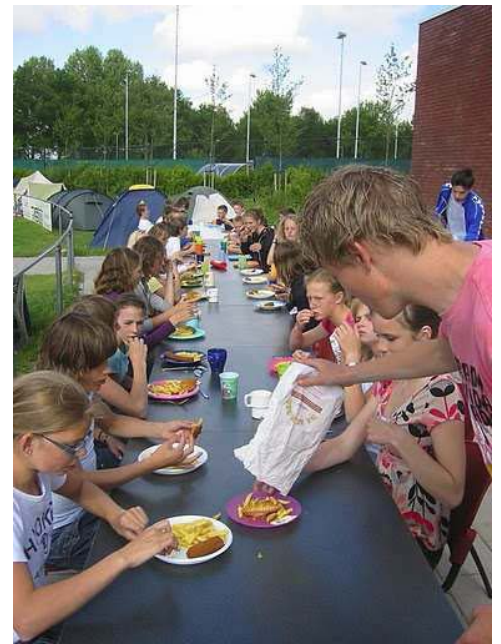
C/D-kamp 2009 op het terrain van AV Trias