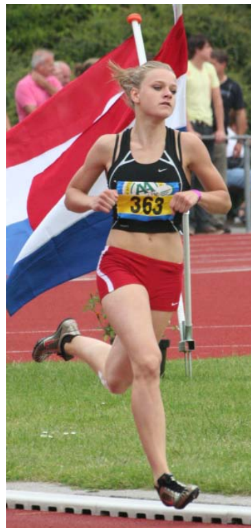
Trias-atleten in actie tijdens Nederlandse Kampioenschappen te Emmeloord 2009