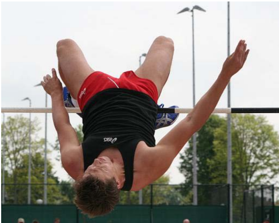
Trias-atleet tijdens competitiewedstrijd

Bij het bereiken van de C/D-Junioren zullen de wedstrijden prestatiegerichter worden, waarbij natuurlijk de sportbeleving hoog in het vaandel blijft staan. De verschillende soorten wedstrijden waarbij de atleten kunnen meedoen zijn eerder al beschreven.